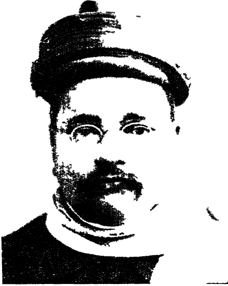
श्रीयुक्त गोपाल कृष्ण गोखले